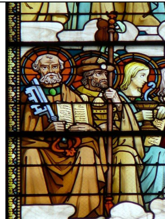
Basilique de Fourvière Lyon

Pour tout complément d'information contacter :