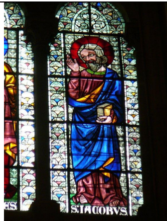
Cathédrale Saint-Jean Lyon