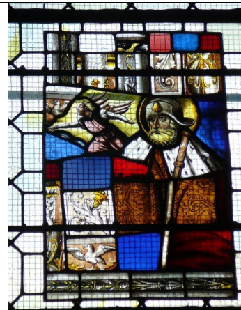
Collégiale Saint-Jacques Sallanches