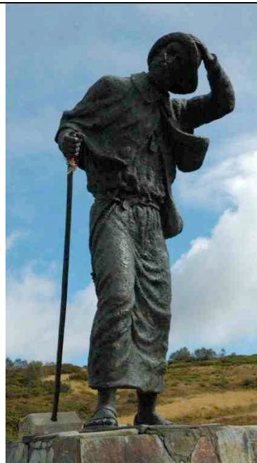
San Roque (O Cebreiro)