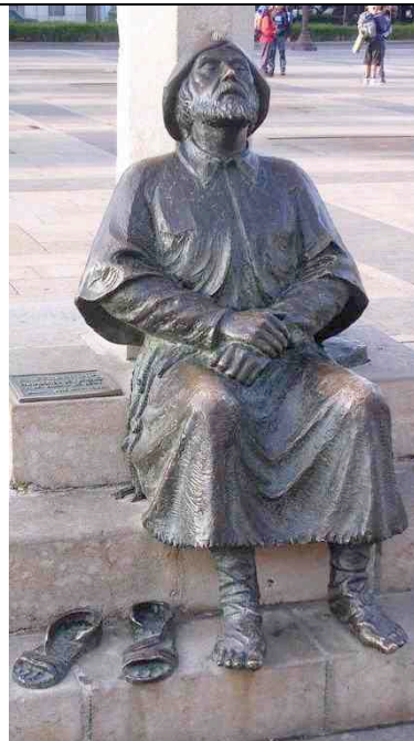
San Marcos (Léon)