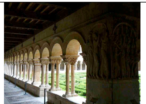
Santo Domingo de Silos

Pour tout complément d'information contacter : Hélène Berthod au 04 50 22 07 66 et 06 73 59 37 16 ou berthodh-stjacques@orange.fr ou Pierre Morel au 04 50 27 26 00 ou pmjamorel@wanadoo.fr