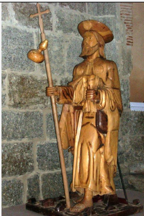
dans l'église de Fuenterrablia